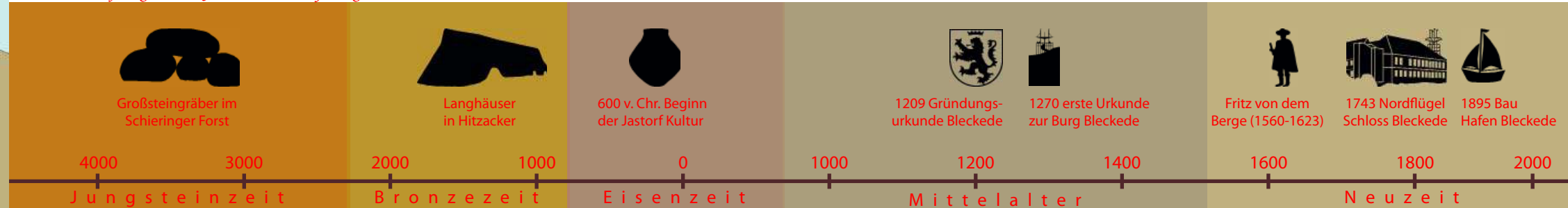
Ein Blick auf die gut 5.000 Jahre von den Großsteingräbern bis heute

Das Hünenbett des Grabes IV ist 40 m lang und 4 m breit. Es handelt sich um ein kammerloses Hünenbett, d. h. es befindet sich keine steinerne Grabkammer im Inneren der Umfassung. Das Hünenbett könnte aber eine hölzerne Grabkammer ent- halten haben. Diese Form ist in Niedersachsen auf die nord- östlichen Randgebiete beschränkt.