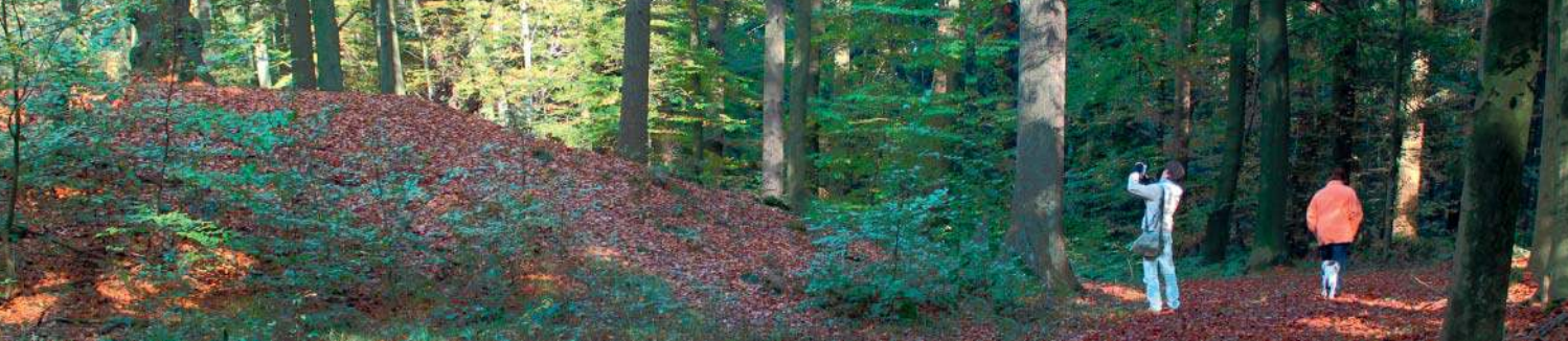
Der sogenannte Opferberg erhebt sich fast vier Meter hoch im Buchenwald